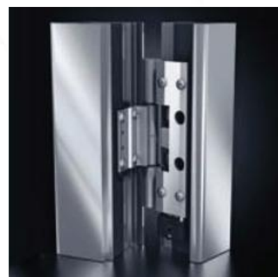
Dobradiças cilíndricas Schüco ADS HD