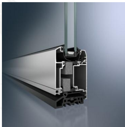
Porta Schüco ADS 70 RL.HI (Linha Residencial)