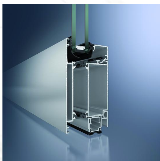
Porta Schüco ADS 70 HD (Heavy Duty)