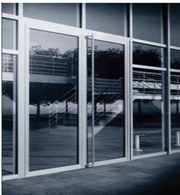
Porta Schüco ADS 70 HD, elevada frequência de trânsito

As instalações de portas Schüco são a solução ideal para uma frequência de trânsito elevada e grandes aberturas. A Schüco também oferece uma porta antipânico de folha dupla classe WK2 com o fecho automático Schüco InterLock.