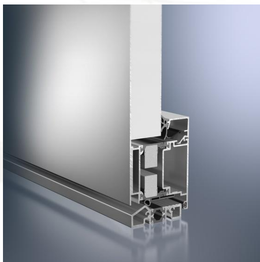
Porta Schüco ADS 70 HI