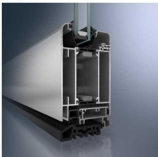
Porta Schüco ADS 70 SL.HI (Linha Soft)